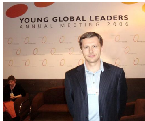
Давос - 2006

Я не хотел ограничиваться сугубо юридической сферой, я хотел сделать свой вклад в развитие и других сфер жизнедеятельности украинского общества. Так в 2005 году я стал членом Совета предпринимателей при Кабинете Министров Украины и работал на улучшение условий ведения малого и среднего бизнеса, а впоследствии был назначен внештатным советником Премьер-министра Украины по вопросам иностранных инвестиций, в которых я хорошо разбираюсь благодаря многолетней работе с иностранными инвесторами . Я писал предложения, готовил программы и планы привлечения стратегических, а не спекулятивных инвестиций, подавал все это на рассмотрение Премьер-министру, но, к сожалению, все осталось только на бумаге. Сначала – из-за нехватки времени Премьер-министра, а немного погодя, в сентябре 2005-го года, случилась неожиданная отставка Правительства.