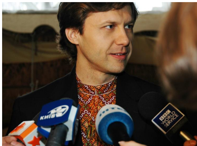
Голос Громады :)

Служить людям и Украине. Сегодня это звучит пафосно, нереально и подозрительно, но это правда. Я действительно решил делать все, что в моих силах для того, чтобы Украина стала сильнее, а украинцы жили лучше и счастливее. Но что делать, чтобы достичь максимального эффекта? Идти в политику или на государственную службу? Сегодня для меня – это напрасное дело. На современном этапе в Украине нет политики в ее реальном смысле, т.е. как искусства управления государством на благо людей. Сегодняшняя украинская, так называемая, «политика» – это грубая и непорядочная борьба за власть ради личной выгоды и наживы. А современная украинская государственная служба в целом – это преимущественно разворовывание бюджета, использования государственного имущества в собственных целях, получение взяток, лоббирование интересов дружеского бизнеса. Конечно, есть исключения, есть честные профессиональные государственные служащие, но их, к сожалению, единицы. И что же делать?