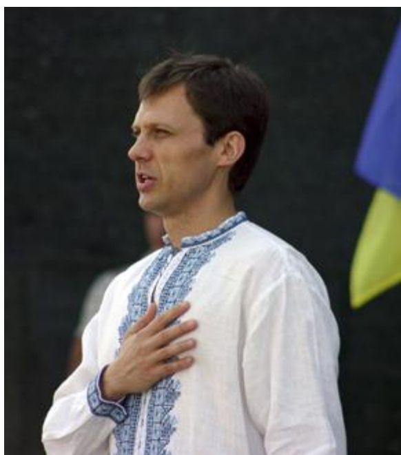
Политика – служение народу!

После полугода активной общественной деятельности я начал понимать, что для качественного и системного изменения многомиллионного общества недостаточно энтузиазма и желания сравнительно небольшой группы общественно активных людей и сравнительно скромных материальных ресурсов. Для выполнения такого амбициозного и масштабного задания требуются большие ресурсы (материальные, человеческие, информационные и т.д.), которыми обладает только государство.