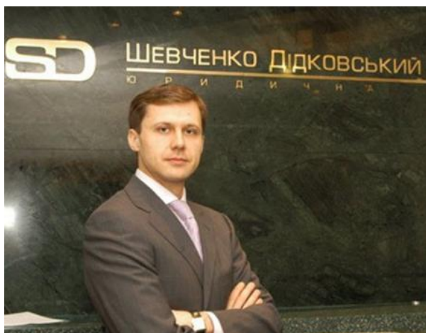
Юридическая фирма №1