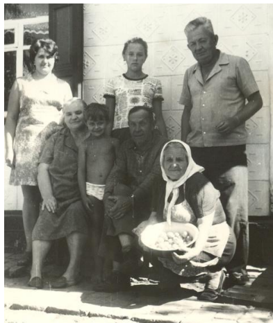
На каникулах в Александрии